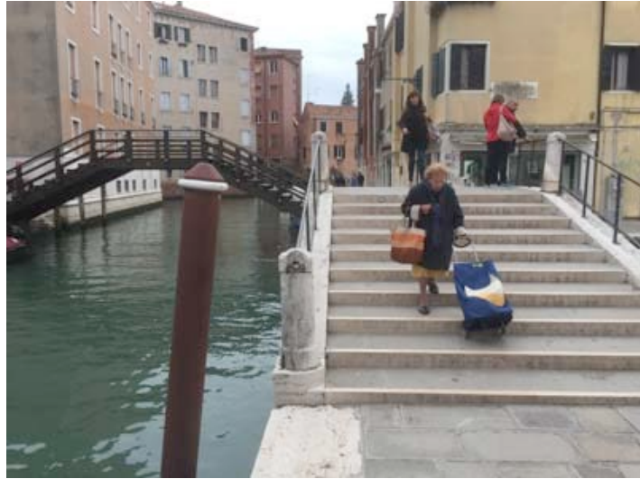
2.ndo Ponte /2 nd bridge, to Calle dei Pensieri

Then turn on the right to Rio Terá dei Pansieri