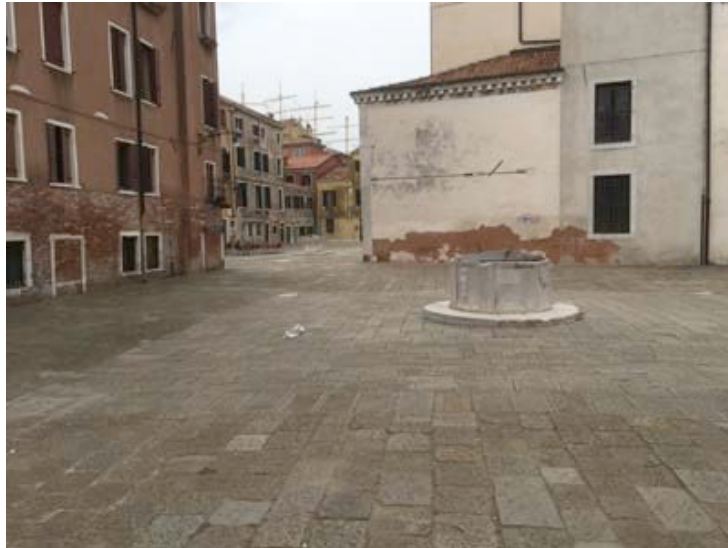
Campo behind the Chiesa di San Sebastiano