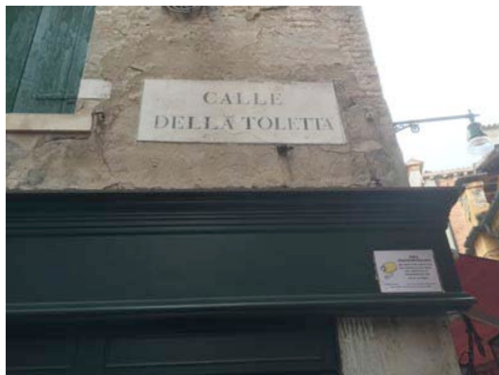
Calle della Toietta

Ponte per Fondamenta Vernier, then Santa Agnese, Rio Terá A. Foscarini, Ponte dell'Accademia, Calle Larga Nani, Ponte to San Trovasio, and Fondamenta Toffetti, Fondamenta Toffetti, Sacca de la Toietta.