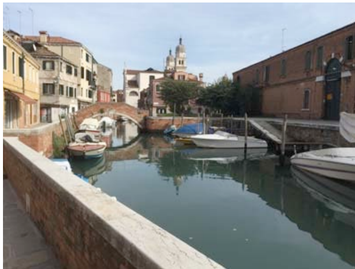
Go on Fondamenta Lizza to the Chiesa di San Sebastiano