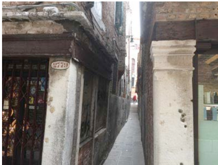
Calle Pistor o del Lotto