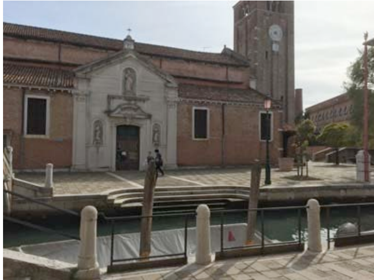
Campo San Nicoló dei Mendicoli