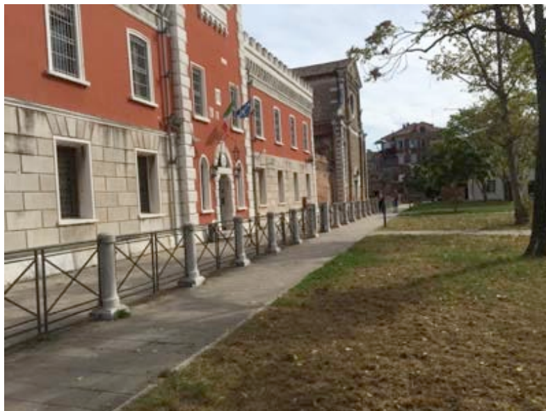
Fondamenta di Santa Maria Maggiore