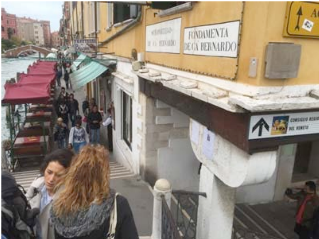
Turn on the right on top of the bridges, to Fondamenta de Ca' Bernardo