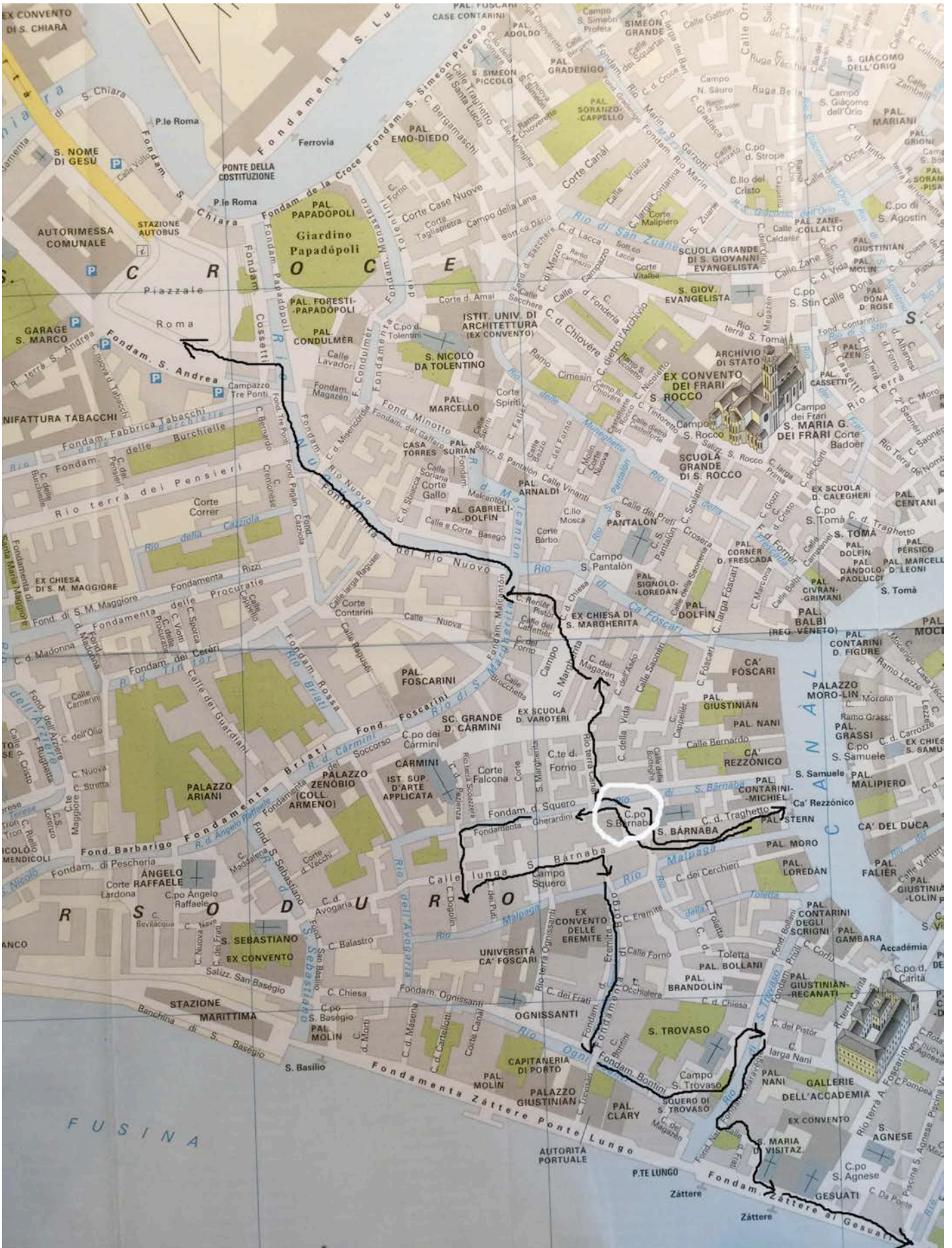
Map 2, travel 22 Dorsoduro-Punta della Dogana