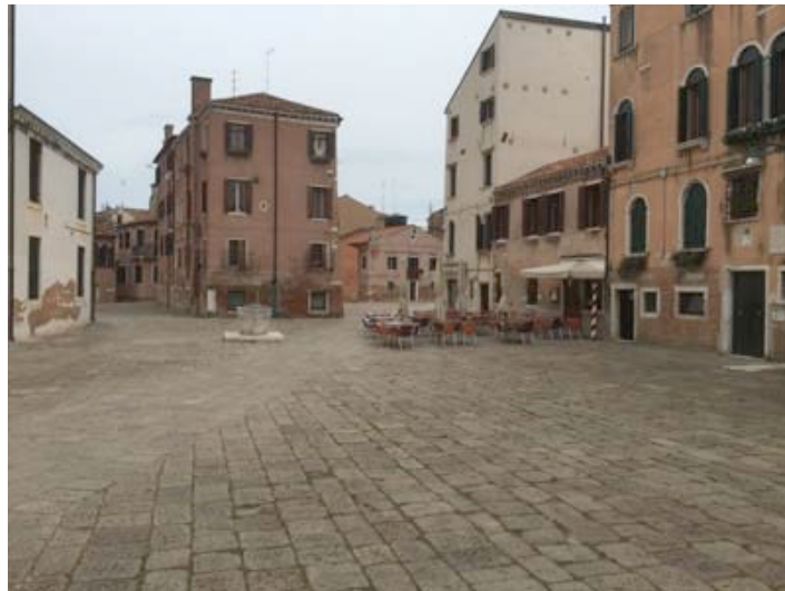
Campo Bevilacqua in front of the Chiesa di San Raffaele