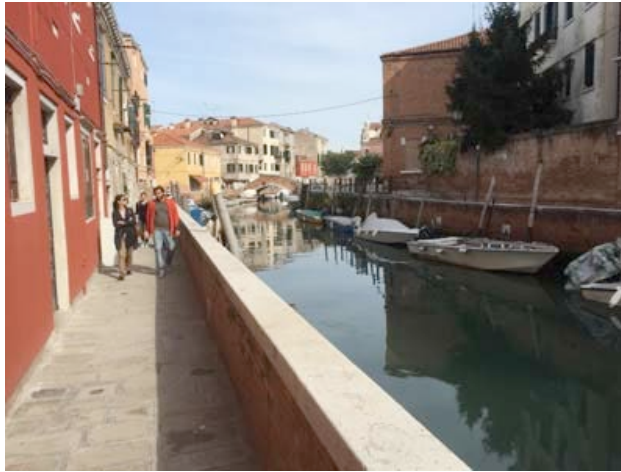
Fondamenta Lizza to the bridge before Fondamenta Barbarigo