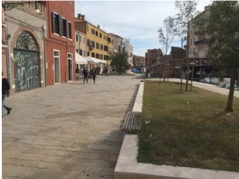
Fondamenta della Madonna