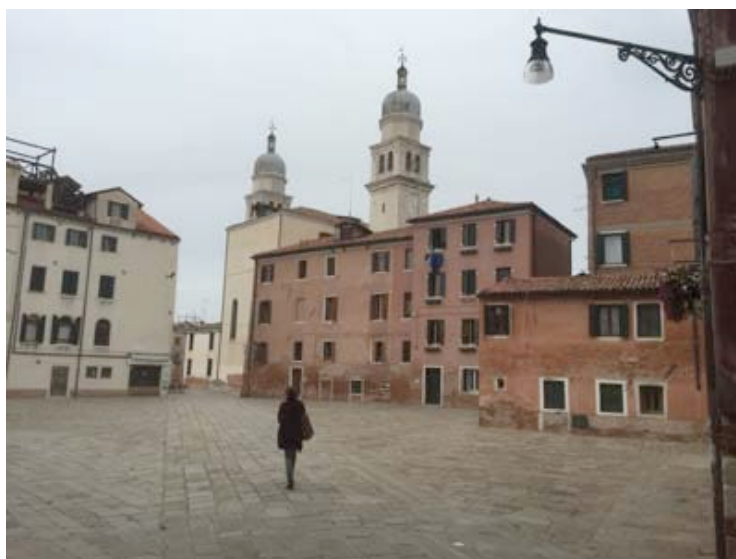
Campo Bevilacqua in front of the Chiesa di San Raffaele