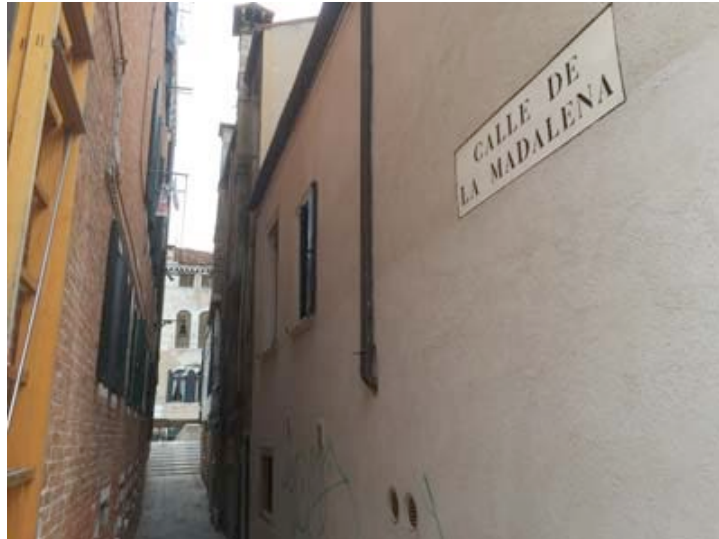
Go around and find the Calle della Maddalena