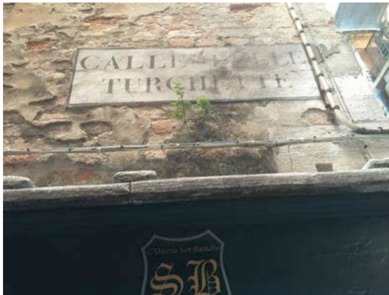
Calle delle Turchette

Find Calle delle Turchette. And follow the Map 2.