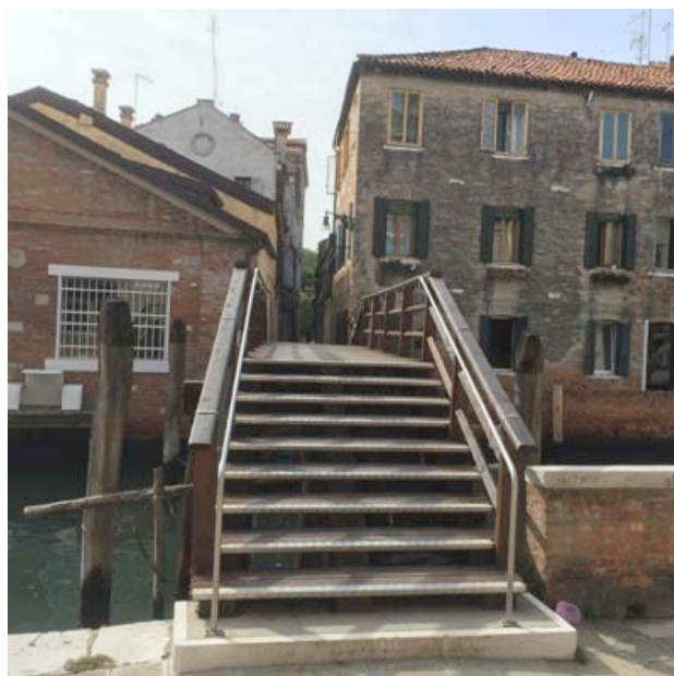
Ponte to Calle della Madonna