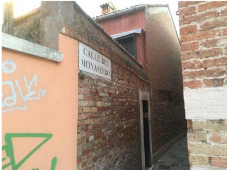
Calle del Monastero