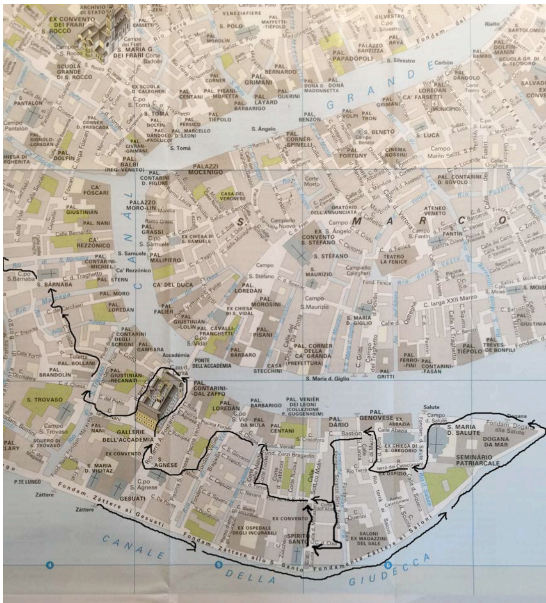
Map 3, travel 22, Dorsoduro-Punta della Dogana