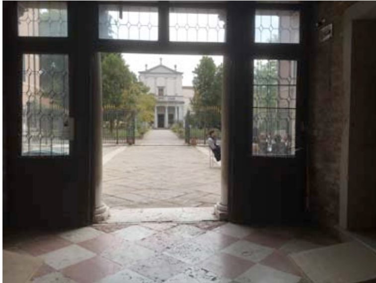
Collegio Armeno Moorat-Rafael

Make a visit to this historical house. A very important place.