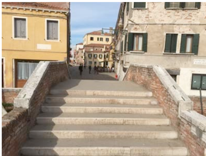
Ponte to Chiesa di San Sebastiano, go in front of the church from the bridge, and turn on the corner.