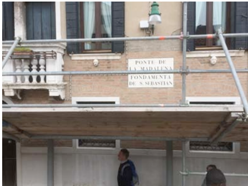
From the Ponte Maddalena go left on the Fondamenta San Sebastiano