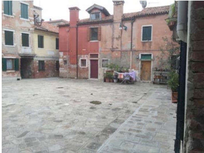
Charming places near Calle Lunga de S. Barnaba

Find Calle delle Turchette. And follow the Map 2.