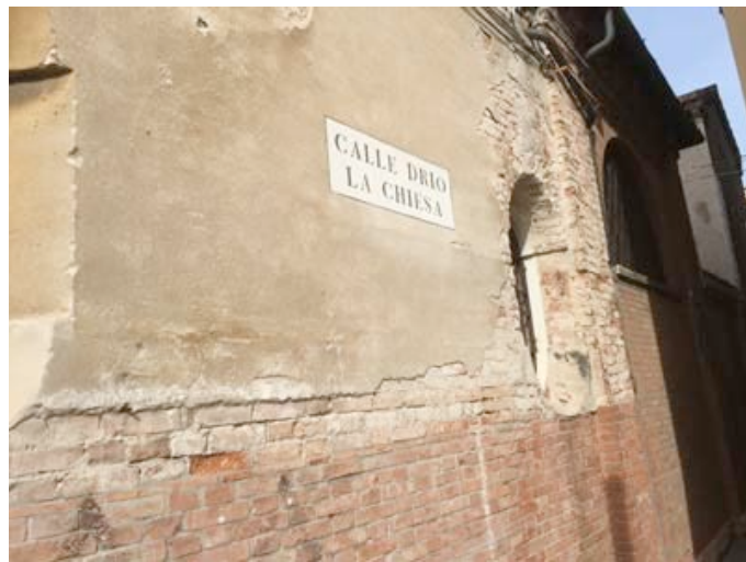
Calle drio la Chiesa just on the other side