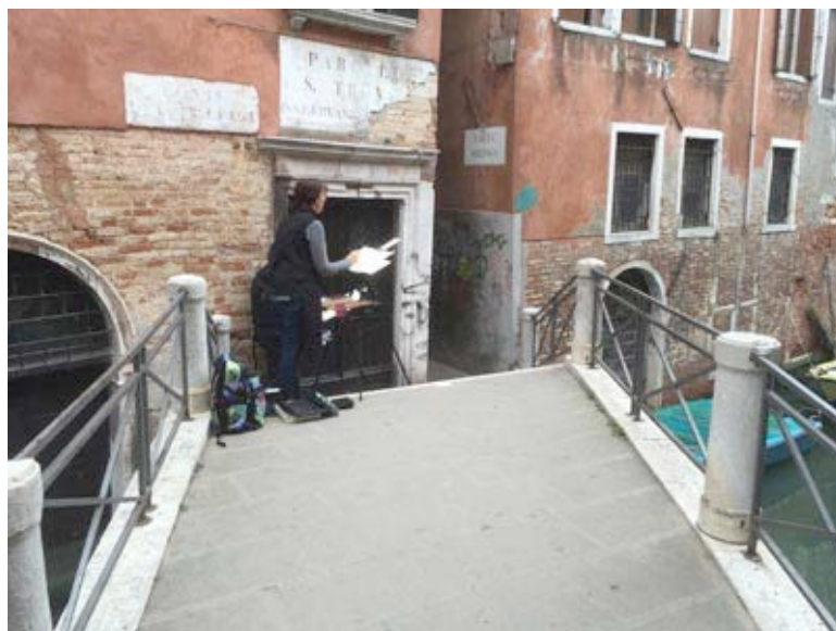
From Calle Malpaga to Calle del Traghetto