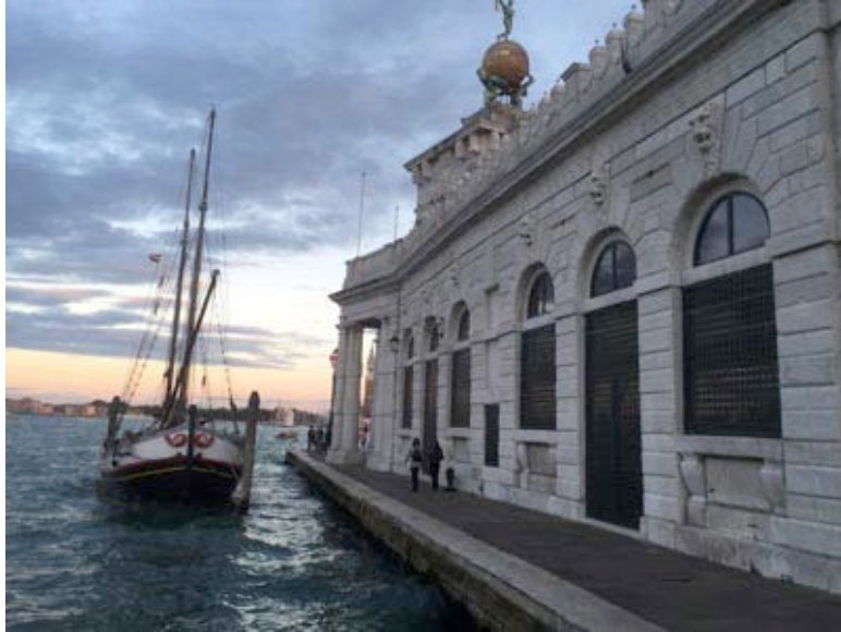
Punta della Dogana to Chiesa della Salute on Canal Grande