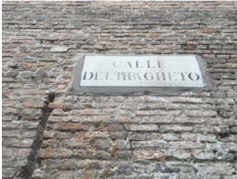
From Calle del Traghetto to Campo S. Barnaba

Go to Ponte dei Pugni, then Rio Terá Canal, Campo Santa Margherita. Find Calle Renier o Pistor and go to Ponte to Fondamenta Malcanton, Fondamenta Rio Novo, Fondamenta 3 Ponti and Piazzale Roma og Railwaystation Santa Lucia.