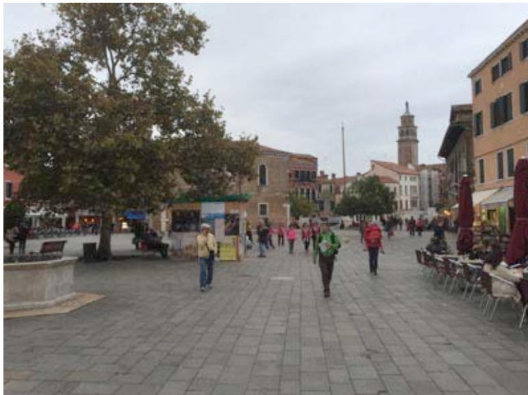
Campo Santa Margherita

Find the Campo Santa Margherita, one of the largest in Venice, with a lot of things to discover.