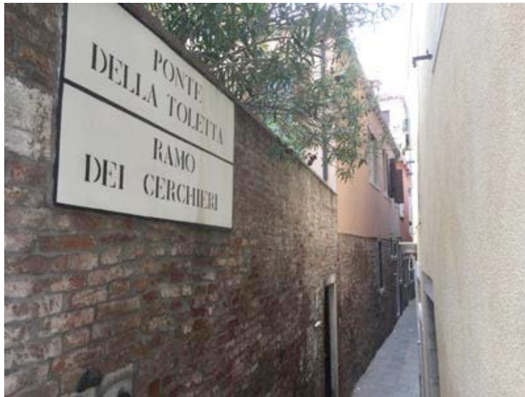
To Ponte della Toletta