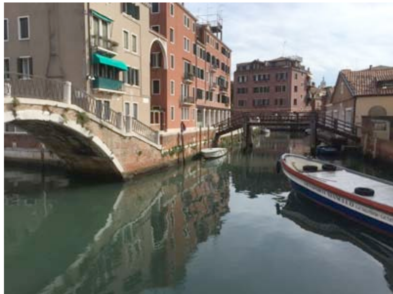
Ponte to Fondamenta della Madonna