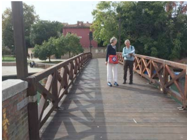
Ponte to Rio tera dei Secchi