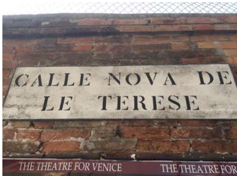
Calle Nova della Terese