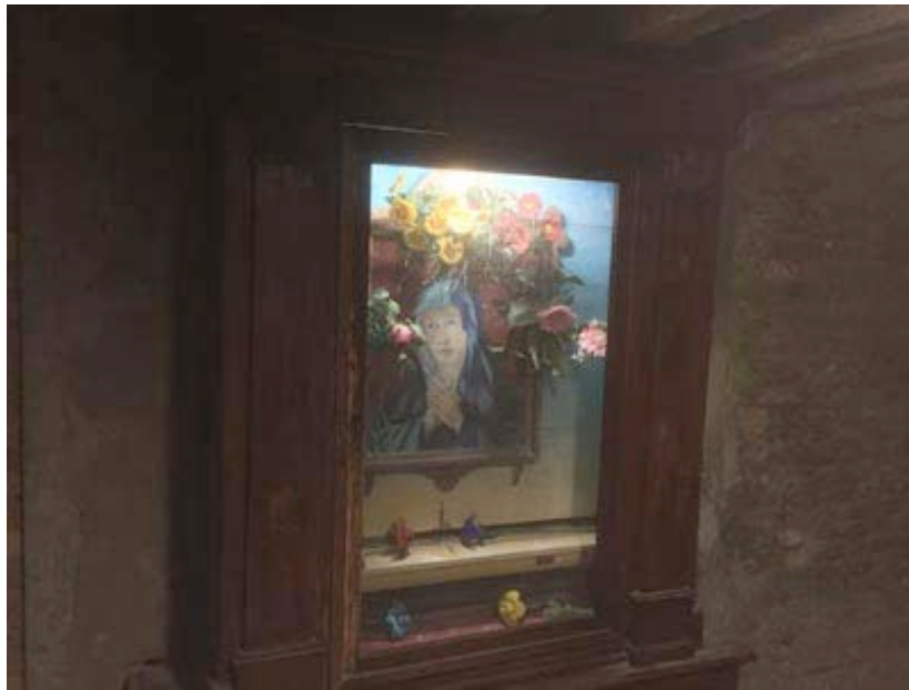
Calle della Chiesa to Campo San Vito