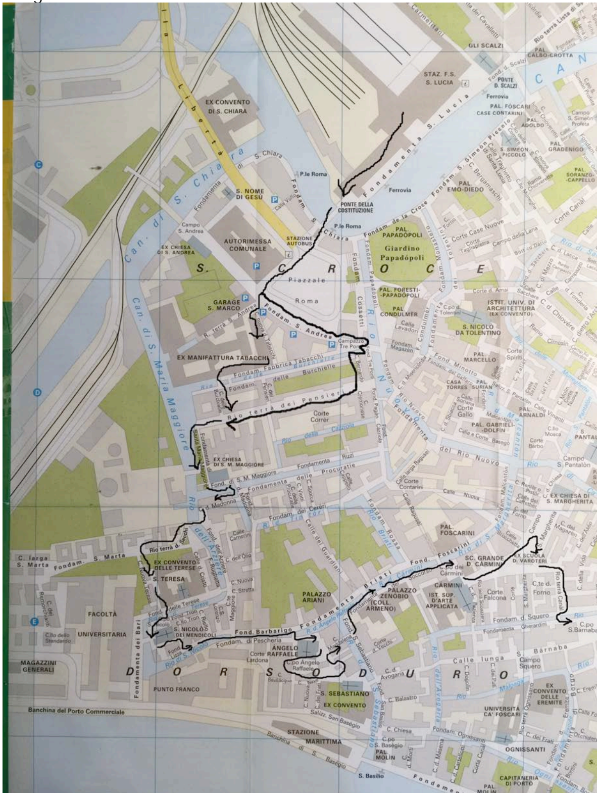
Map 1 for travel 22 Dorsoduro-Punta della Dogana

The start is the Railway station Santa Lucia or the Car station Piazzale Roma . Judge which one horrify you mostly. At Piazzale Roma where the little train from Tronchetto arrives, go straight to the 3 Ponti-3 bridges.