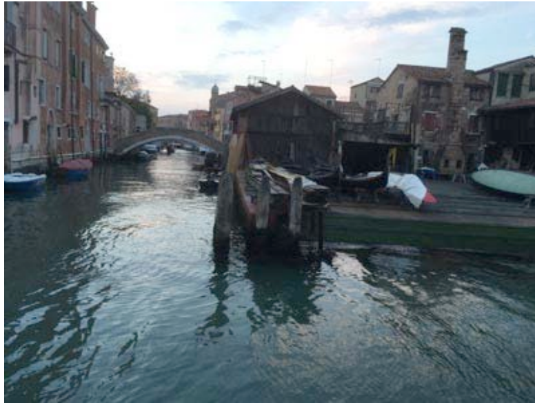
Fondamenta delle Meraviglie to Calle dei Frati and Fondamenta Zattere dei Gesuati to Punta della Dogana