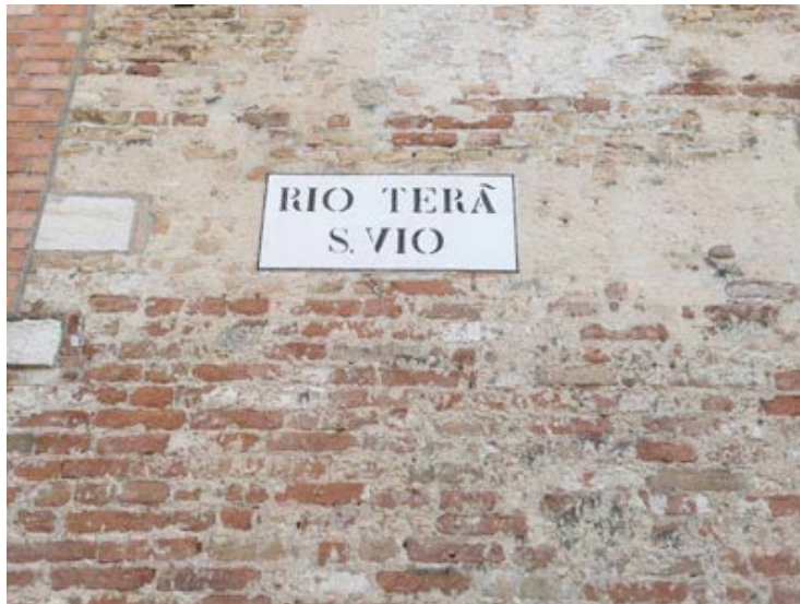
Rio Terá San Vito, then Corte delle Mende