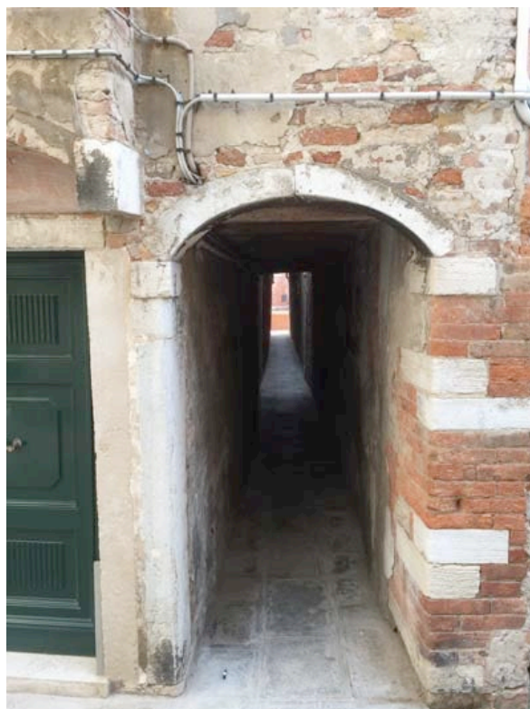
Tunnel on the Calle drio la Chiesa