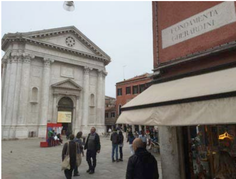
Church and Campo Santa Barnaba

From Campo S. Margherita go to Ponte dei Pugni and then turn left to Campo S. Barnaba