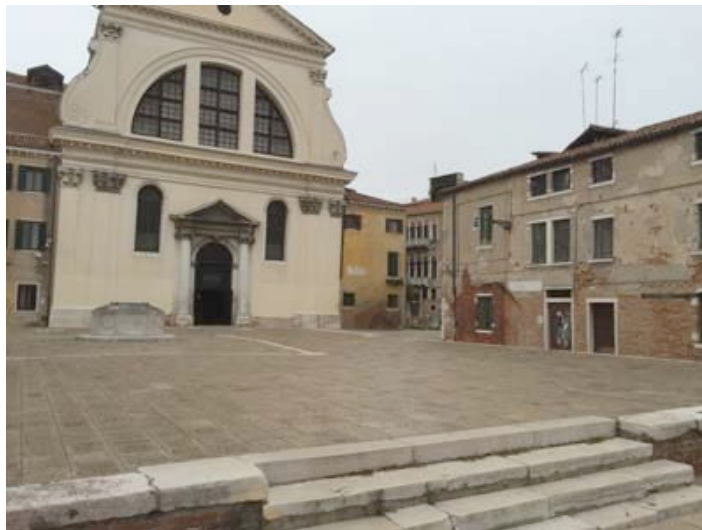
Chiesa dei Carmini on Fondamenta del Soccorso

Then, icontinuous to Chiesa dei Carmini.