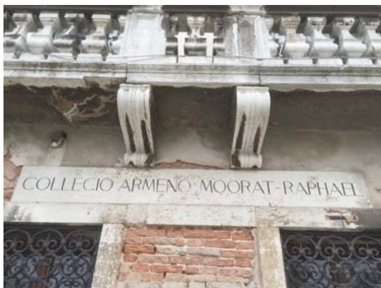
Entrance of Collegio Armeno Moorat-Raphael on Fondamenta Soccorso