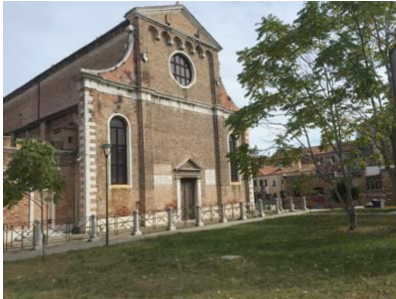
Chiesa di Santa Maria Maggiore