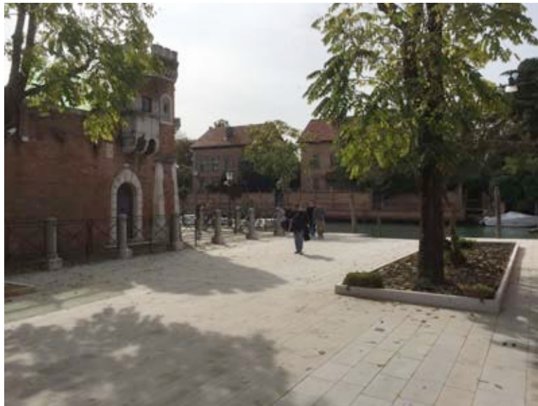
Rio Terá dei Pensieri

Then turn on the right to Rio Terá dei Pansieri